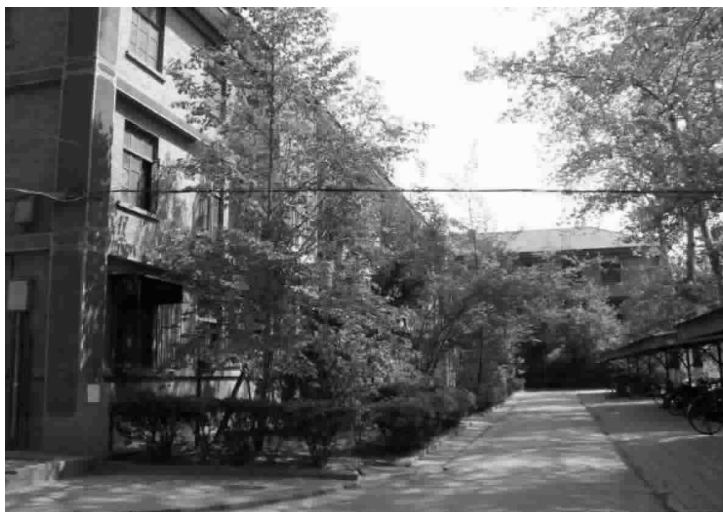
○ 中关村北区的15楼(摄于2007年春)

中关村北区的13楼、14楼和15楼亦称特楼，朝南呈「」字形。14楼是一字型，13和15楼是倒L型的。这些楼里住过许多科学界泰斗级的人物，大多是一级研究员、研究所的首任所长、副所长，包括中国科学院的首批学部委员32人以及9位1948年中央研究院院士。后来在1999年的“两弹一星功勋奖章”获得者23位科技专家中有8位曾在这里住过(包括10号灰楼的陈芳允)。特楼里不仅学界泰斗荟萃，而且有的师徒同楼——14楼里贝时璋的夫人就是对门钱三强夫人何泽慧的中学老师，而住一层的赵忠尧先生则是钱三强三十年代就读清华物理系的老师。除了建国前就在国内工作的著名科学家外，13楼、14楼还迎来了钱学森、赵忠尧、郭永怀、汪德昭、屠善澄、杨承宗、杨嘉墀等一大批刚刚从海外归来的科学家。13楼的住户里很多是新中国的第一批“海归派”，三四十岁的他们刚刚从海外归来就直接来到中国科学院工作。